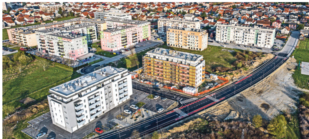
Splitska Trogirska Grabanice